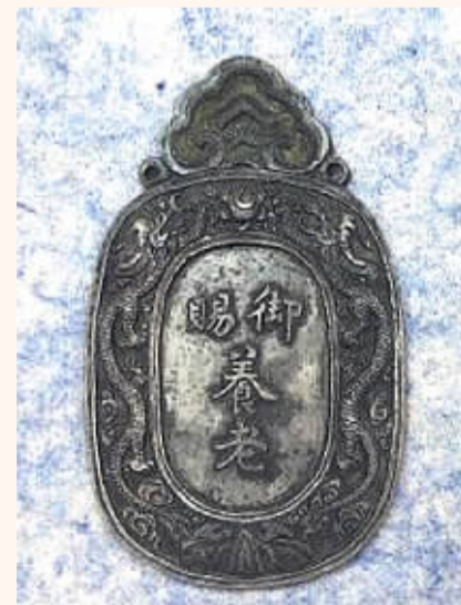
首都博物馆藏乾隆五十年千叟宴养老银牌

日本木刻版画画家冈田玉山(1737-1812)曾出版《唐土名胜图会》图籍,其中大量描绘了清乾隆时期皇宫和皇室生活。乾隆五十年千叟宴场景,亦反映于此图籍中。画面上方有“乾清宫千叟宴”几个字,下方则是欢快热闹的宴会场景: