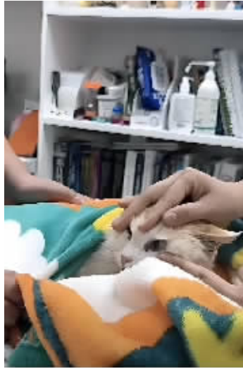
中国小动物保护协会工作人员为猫做检查

在短视频平台，可以看到中国小动物保护协会针对此次事件进行了密集直播，均具话题性，如“猫咪已经被安置好了”“猫咪检查回来了一切顺利”等。巨大的关注度和流量不断涌入。