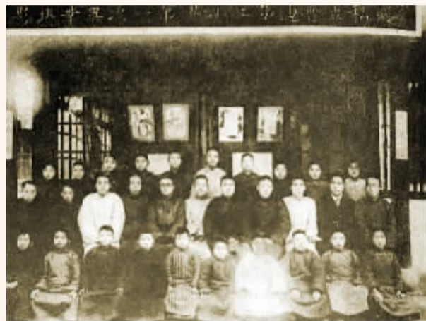
1930年普迪二校第一次毕业照片

秉持着勤、俭、公、忠四字校训，普迪小学的孩子们也格外争气，克勤克俭，为造福社会、服务民生而奋发学习。