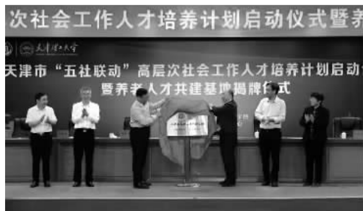
天津市“五社联动”高层次社会工作人才培养计划启动仪式暨养老人才共建基地成立