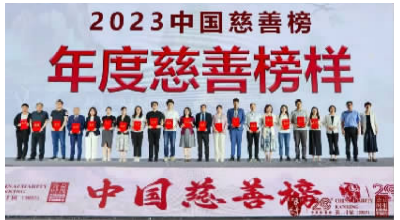
第二十届中国慈善榜活动现场

更多大众力量参与,让当地村民在可持续发展中受益,这是生态保护和生物多样性保护实现的关键。