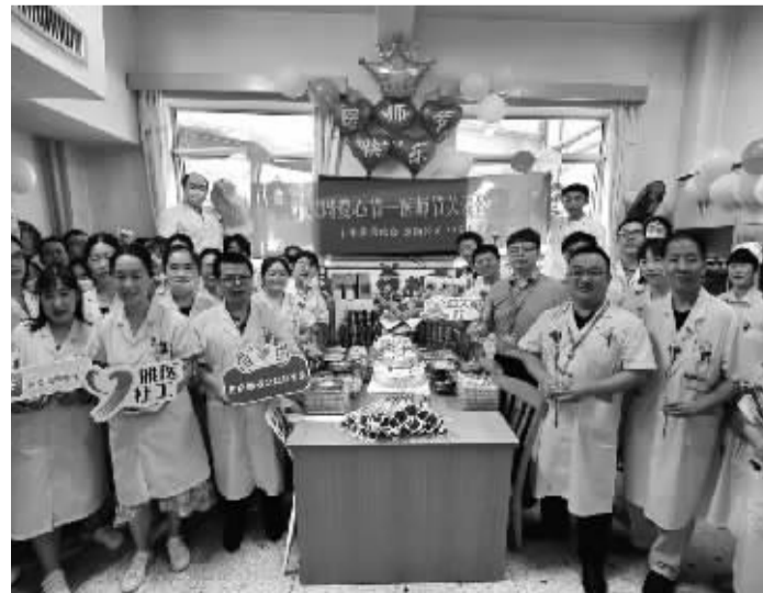
中南大学湘雅三医院欢度医师节