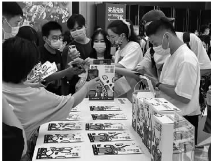
“U设计周”艺术家联名口罩展位

展现,主要是想与年轻群体有更多的交流。“而我们选择把更多有意义的元素印在口罩上,主要是希望日常佩戴的口罩不再只