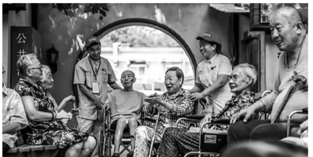
北京社区养老驿站资料图

在发展就近养老服务方面,落实居家养老服务条例,完善街道社区就近养老服务网络。健全