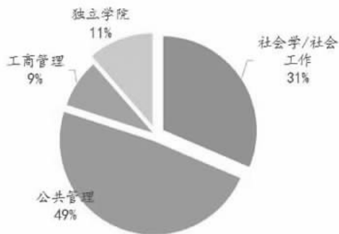
高校公益慈善人才培养项目学科背景分布

《报告》指出,高校慈善教育的发展规律与展望存在于“学科背景”“发展动力”“主要障碍”三个方面:学科背景,正由公共管理学科发轫向工商管理介入,再向社会工作背景发展,总体话语正在从非营利组织管理向公益慈善变迁,社会创新创业话语在通识教育中更为突出;发展动力(专业教育),以行业需求驱动和高校创新驱动为主,市场驱动乏力、政府推动缺位,目前高校创新驱动主要依赖“一把手”,在学科制度限制下创新存在“边缘效应”;主要障碍(专业教育),主要表现为受教育需求不足、教育供