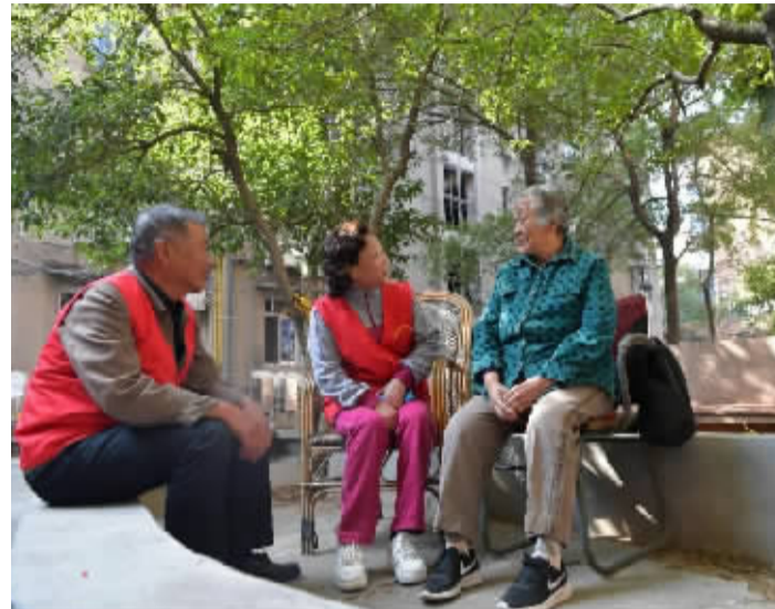
2019 年 11 月,在江西省新余市渝水区新钢街道含笑社区,“敲门嫂”志愿服务队在社区里陪一名老人聊家常