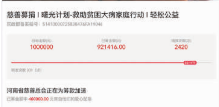
“曙光计划”筹款链接截图