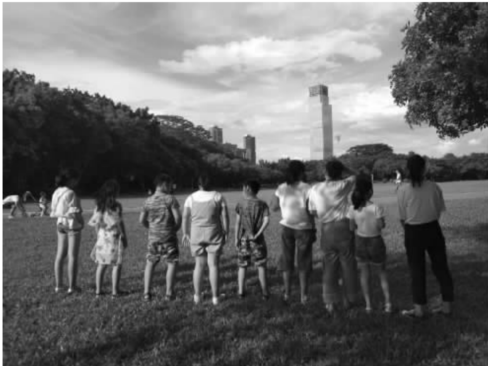
一群无法在深圳升学读初中的六年级非深户毕业生离开深圳前的背影

围绕流动儿童群体生存现状、发展特征、入学政策、升学政策等问题,呈现了流动儿童教育的现状,比较了各地政策的友好程度差异,分析了流动儿童的心理发展状况,特别关注了回流儿童、再迁儿童等儿童群体的教育,并通过对地方案例和社会力量的教育实践的梳理,展现了我国流动儿童教育的新动态。