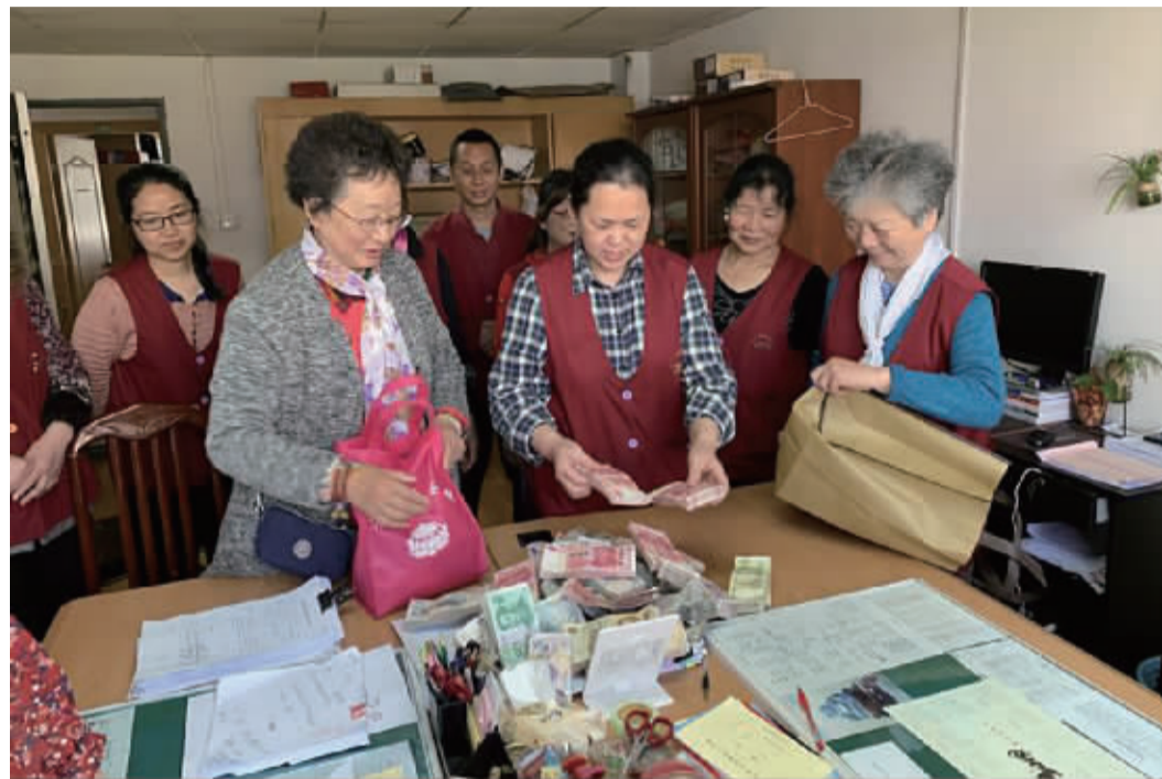
“顺其自然”带动了大量爱心人士为困难群体捐款

1999年12月6日，捐款5万元，用于给特困家庭送温暖；2000年12月5日，捐款20万元，用于建造余姚市梁弄镇横坎头村“仁慈教学楼”……2019年