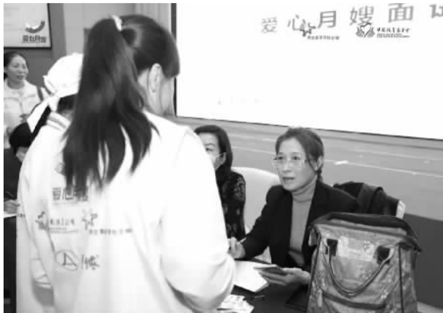
“爱心月嫂”的面试现场