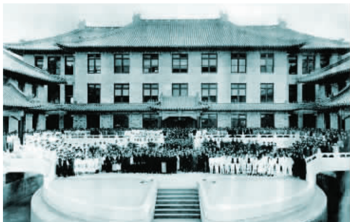
协和医院启动典礼