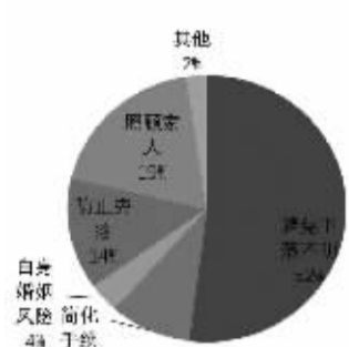
30岁以下立遗嘱理由

从“90后”人群立遗嘱增长的趋势来看,越来越多的“90后”接受并愿意订立遗嘱。白皮书显示,2017年有55位“90后”在中华遗嘱库登记保管了遗嘱,2018年累计178人,截至2019年底,