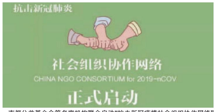
南都公益基金会等多家机构联合启动“抗击新冠疫情社会组织协作网络”

复,无论针对湖北或是其它地区的社区恢复工作,这部分是公益组织可以挖掘的。除了这部分机构外,更多机构在此期间可能只能勒紧裤腰带过日子了。”