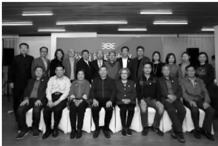
公益链启动仪式暨共同发起人会议合影

“公益的第一使命是生产信任,创造社会资本。在这个问题上,我们实际上一直面临着挑战、质疑,经常是一荣不能俱荣,但是一损就会俱损。在这种情况下,公益非常无助,怎么构建公信力?这个实际上难度很大。”徐永光表示,“区块链不仅是一种技术,而且里面带有一种人类所梦寐以求的价值,即信任机制。”