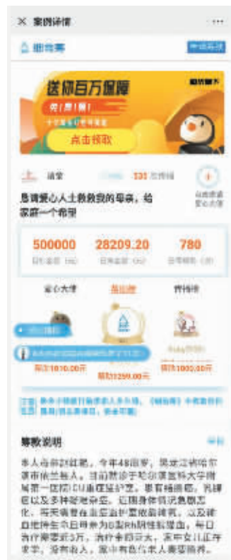
张小姐的筹款页面

郭然指出,关于该平台的运行模式。第一,求助者一旦填写完信息点击提交,即在求助人与平台之间形成服务合同关系,服务内容是平台提供发布信息服务、收款服务和支付服务等。第二,爱心人士一旦完成赠款支付,与平台形成委托支付关系。因此,即使“细雨筹”证明所有求助人都充分知晓该平台仅为个人求助信息发布平台、所有爱心人士均明知求助信息需自行核实,那么“细雨筹”目前延期支付的行为构成违约,应当由平台的