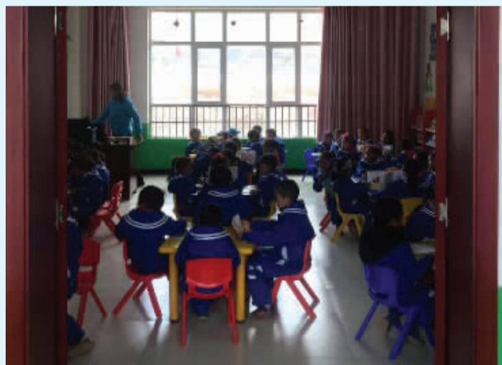
2016年4月12日吴世勋生日之际,粉丝为了给偶像惊喜传递偶像正能量,在青海为贫困儿童建立的第一座爱心图书馆——“吴世勋爱心图书馆”

为危桥,为了出行人安全问题,已停止使用该桥,因此沿河两岸的群众出行、学生上学都不得不绕道近三公里距离,尤其在冬天下雪路滑,小孩上学,老人出行看病都非常不方便。而且近年来,村民们为摆脱贫困积极尝试发展养蜂、养鸡等小产业,由于地形及财力等制约,所需物资均靠人力运输,无桥可用的现状也严重影响了产业输出。吴世勋粉丝捐助修建一座15米跨径工字钢人行便民桥,方便村民出行,同时也带动了本地产业发展。精准扶贫带动当地产业发展,修桥后每一年的汛期,村民们将不再提心吊胆的出行,可以加大力度发展养蜂、养鸡等产业,再加上紫阳县政府帮助,可以更有效地