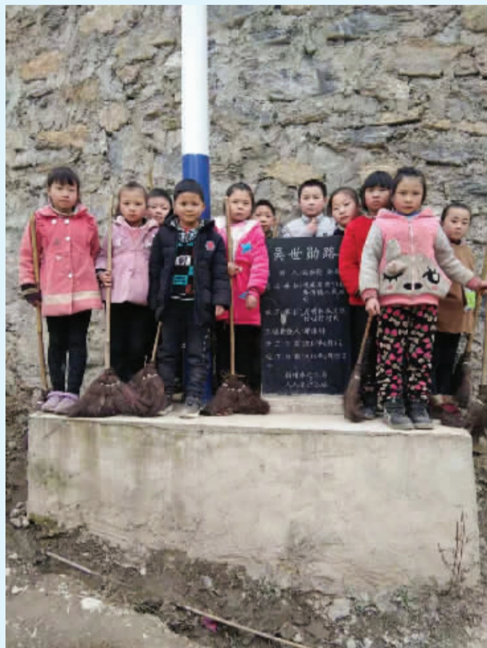
吴世勋粉丝在陕西省安康市紫阳县麻柳镇作坊小学修建了一条吴世勋路。图为学生们在石刻的“吴世勋路”前合影

2019年4月12日,粉丝又以吴世勋名义在陕西省紫阳县麻柳镇水磨村修一座桥,桥的名称命名为“吴世勋思勋桥”。陕西省紫阳县是“国家深度贫困县”,水磨村下店子的人行钢便民桥,原修建的铁索桥年久失修,已成