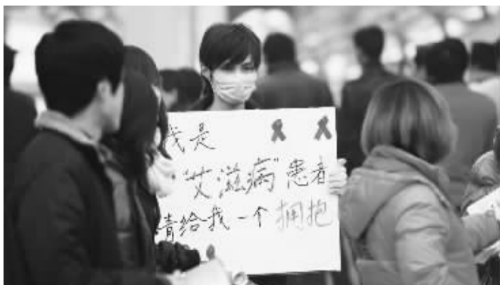
大学生志愿者扮“艾滋病患者”求拥抱,宣传防艾知识(网络配图)