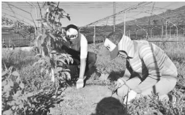
孩子的书屋业务扩展至多个方面,图为他们开辟的菜园

新的行动:租下一间旧平房,改建为咖啡育成中心,并为中心取了一个有记忆点的好名字——黑孩子黑咖啡。和之前的思路一脉相承,团队鼓励孩子们“做中学”,让他们藉由全程参与装修过程,积累建筑经验。