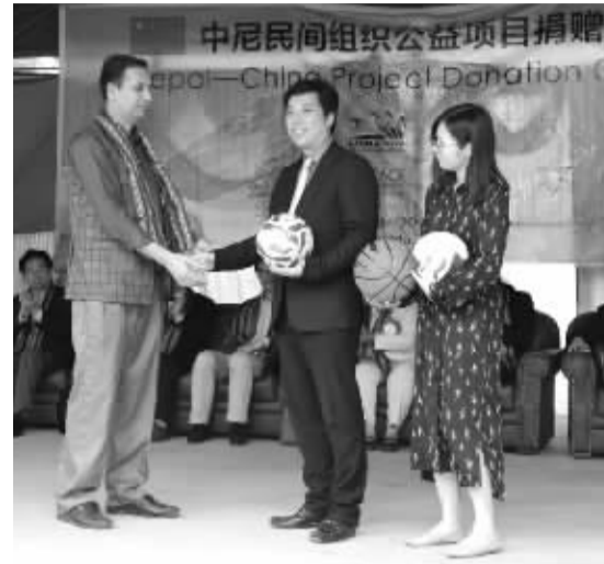
7月30日,中尼民间组织公益项目捐赠仪式在位于尼泊尔首都加德满都的马亨德拉·阿达莎·维蒂莎姆学校举行。捐赠的物资包括爱心书包、体育用品等。图为北京慈爱公益基金会向尼方捐赠体育类物资。