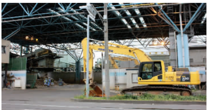
东京都废弃物填埋处理场内正在进行垃圾分类

2013年,玛氏箭牌在中国启动了“垃圾投进趣”公众教育项目,以“垃圾投进桶、世界大不同”为理念,致力倡导“包好不乱丢”的文明意识、培育妥善处理垃圾的负责任公民行为、营造更绿色更洁净的社区。项目以生动、趣味的形式,在社交媒体及公众社区成功发起多个主题活动,包括“随身垃圾袋大学生创意设计大赛”、“垃圾投进趣”青年公益实践大赛、学生志愿者下社区活动、“腾讯乐捐:支持环保一步之遥”微信公益活动等等。目前,项目通过富有创意、趣味的线上线下活动,直接影响的公众人数已累计超过500万。