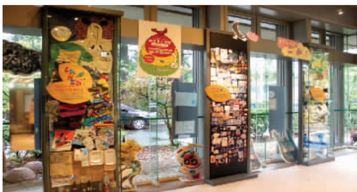
京都市环境保护活动中心陈列的不同类型的垃圾橱窗