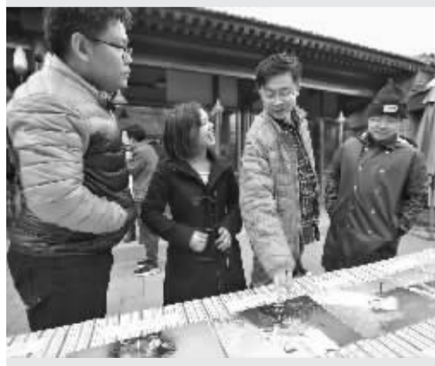
12月1日,“救助儿童会全纳教育‘筑梦’影展启动会”在京举行,影展展出了偏远山区孩子们(含残障儿童)的三十余幅摄影作品

2017年,除了摄影项目外,救助儿童会在云南和四川也做了不少推进全纳教育的试点工作,开发《全纳教育ABC》教师培训教程,并在努力洽谈与四川省教育科学研究所的合作,计划在20个县开展教研员及特教资源中心教师TOT培训,预计覆盖教师8500名。另外,救助儿童会与云南省特殊教育资源中心、国家特教改革试验区昆明市五华区教育局建立为期三年的项目合作关系,探索建立以学校支持为主体、社区支持为基础、政府支持为主导的全纳教育模式,以保障残障儿童的教育权利,进一步提高残障儿童的基础教育水平。(王勇)