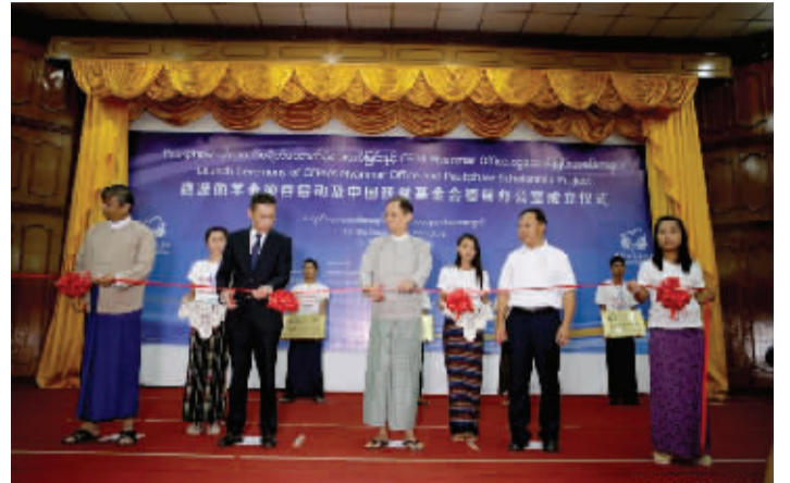
近年来,越来越多的社会组织走上国际化之路。图为2016年8月5日,中国扶贫基金会缅甸办公室成立仪式在缅甸仰光举行。

不过也有人提出疑问:很多企业都有自己的企业社会责任部门,那还需要NGO参与吗?上