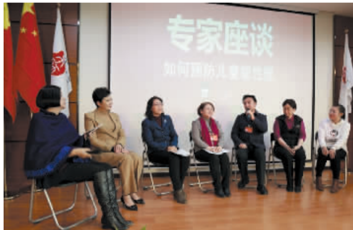
2017年3月2日,2017年“女童保护”全国两会代表委员座谈会在北京召开。图为专家座谈,讨论如何预防儿童被性侵。

同时,在公开报道的案件中,受害者为农村(乡镇及以下)儿童的有329起,占比75.98%;受害者为城市(含县城)的为100起,占比23.09%。自2013年到2016年,这是农村地区公开报道的案件首次高于城市地区。表明