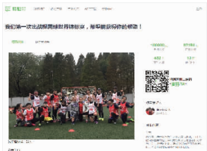
被约谈后,轻松筹将违规项目的发起人由中国棍网球协会调整为棍网球女队

“事件本身的初衷应当是善意的,无论是冠以‘体育梦想’还是‘推动棍网球在国内发展推广’之名,都是值得鼓励的,但各参与方在此过程中应当依法行事,充分披露真实信息,力求各方知悉,且对行为性质进行明确提示,”刘律师称。(部分内容综合其他媒体报道)