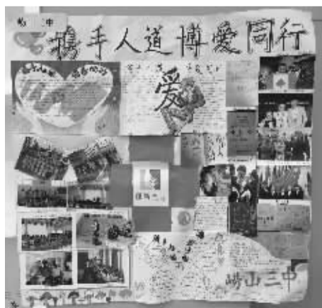
学生的人道法学习作品

循着探索人道法项目的实施路径,希望有更多机构的公益理念课程进入校园,真正实现公益慈善从孩子开始培养的目标。