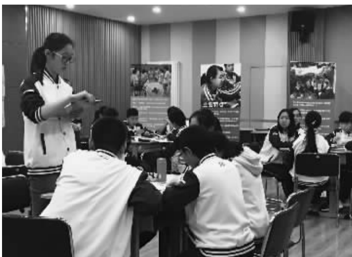
青岛二中的学生们在上探索人道法课