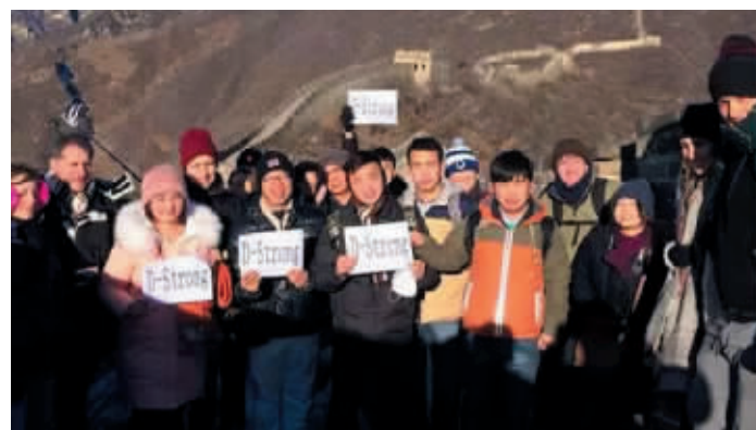
为了实现多里安的心愿,网友在长城拍照