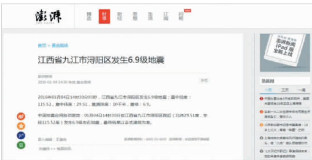
澎湃发布的地震消息