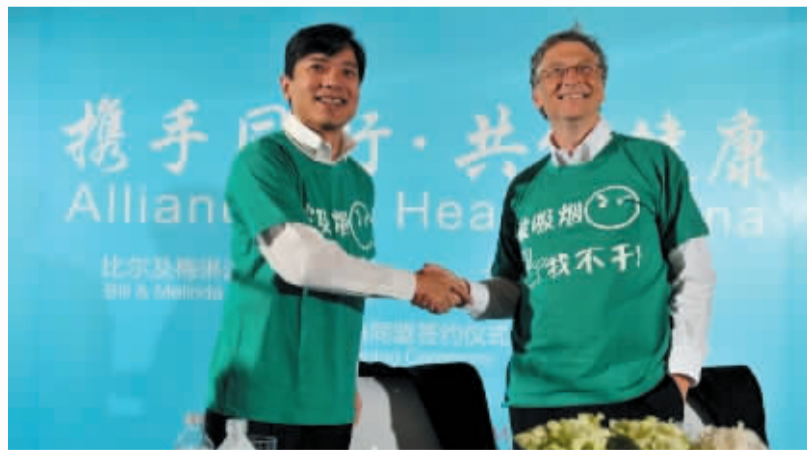
盖茨基金会和百度公益基金会联手推出了“被吸烟,我不干”宣传倡导活动。

调查结果显示,北京市成人现在吸烟率为23.4%,由此推算,全市有419万吸烟者。从事室内场所工作的成人在工作场所二手烟的暴露率为35.7%。这一数字扩大到全国,吸烟人数超过3亿,遭受二手烟危害的不吸