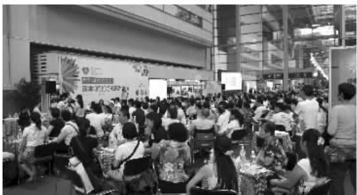
本报记者曾报道过深圳慈展会上300人参与的“世界咖啡屋”交流活动,现在,这个理念又被赋予了更多的价值和意义

述他们带来的会议线索,这个桌子的讨论继续进行,并随着新一轮讨论的开始得到加深。三轮或更多轮以后,整个小组集合在一起分享并探究出现的主题、领悟和学习结果,通过图表或者其他方法将整个小组的共同智慧显示给每个人,这样他们都可以思考这个房间提出的问题。到这里,会议可以结束,也可以开始新一轮的问题探究或质询。