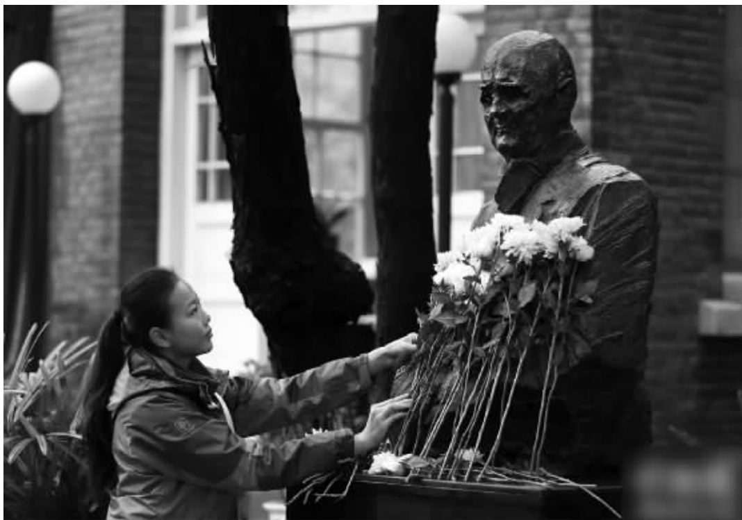
11月23日,南京市民在拉贝130周年诞生之际向他的雕像献上鲜花

为纪念拉贝先生的正义之举、弘扬国际人道主义精神和促进国际文化交流,2005年12月,西门子携手合作伙伴共同修缮拉贝故居,使得拉贝纪念