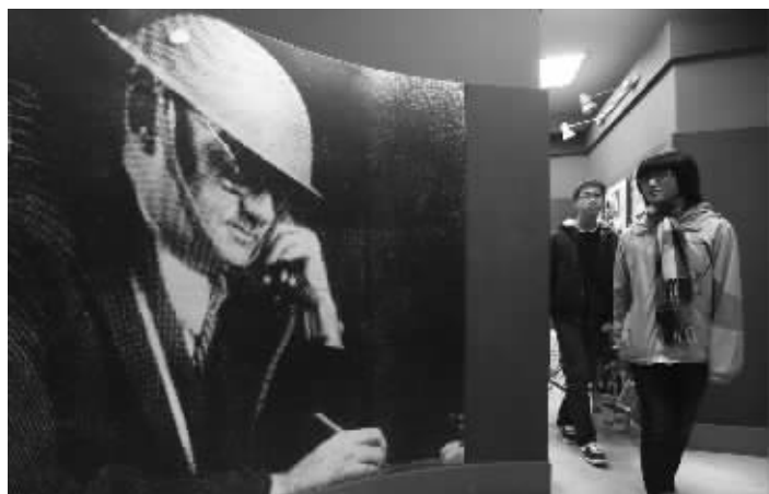
当天,学生在约翰·拉贝故居内的展览区参观

馆在开馆6年间接待了10万余名参观者。2007年故居修缮之后,西门子又协同多方联合设立了“拉贝与国际安全区纪念馆和拉贝国际和平与冲突化解研究交流中心发展基金”,并于2012年追加了对该基金的投入。