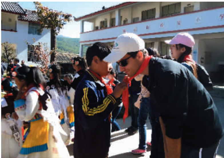
志愿者选拔条件可谓苛刻,除了工作方面成就优异,还需要公益志愿服务经历和饱满的热情