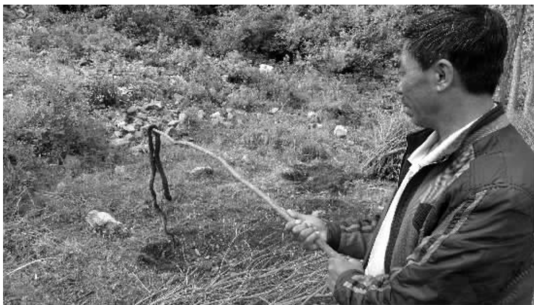
村民向记者展示被打死的蛇

据了解,5月31日当天有一帮人在北京东四环花鸟市场购买了数千条蛇和数百只鸟来到这儿放生,由于放生地离该村村民家较近,致使许多蛇爬到了居民家里面,对居民正常生活造成困扰。从6月1日开始,苗耳洞村村民便放弃每天干农活时间,以每家出一个劳力的方式,约50多人对乱窜的蛇进行捕杀,至7日,共计捕杀1000余条。