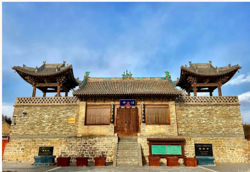
坐落于山西省寿阳县平头镇黑水村的福田寺,始建于唐,元至顺四年重建,清代多次重修

大力推广教育救助。中国古代设立的太学、国子监等高等教育培养只有极少数人才能享有,蒙学等初等教育的完成基本上就是由宗族来实施的。宗族通过建立庄塾、家塾或私立学校,积极为本族子弟提供读书入仕的机会。明清时期施氏义庄设家塾,“凡族中幼稚子弟均可入塾肄业,俾受普通教育”。还资助住所离庄塾较远的幼童另外“择师附学”。同时还通过资助学费、免收学膳费、补贴奖励应试升学等举措鼓励子弟求学入仕。有的宗族还特设恤孤家塾,免费让孤幼入塾读书,并在他们出塾谋生时赠送“衣履之费”。教育的内容先从“孝”“善”等社会基本伦理道德的教授和灌输开始,继而习读《朱子小学》及四书五经等儒